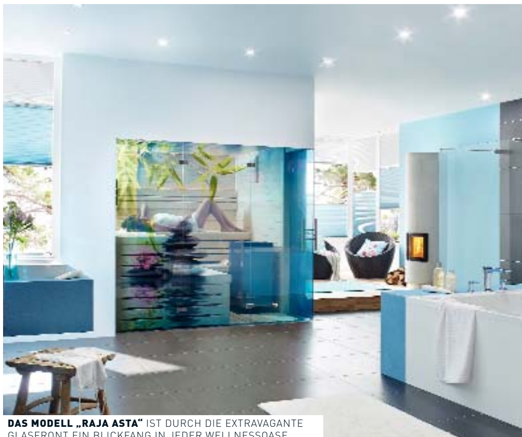
DAS MODELL „RAJA ASTA“ IST DURCH DIE EXTRAVAGANTE GLASFRONT EIN BLICKFANG IN JEDER WELLNESSOASE.