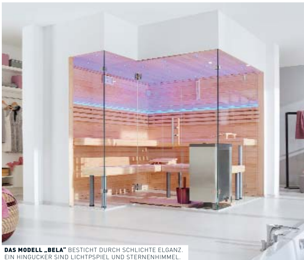
DAS MODELL „BELA“ BESTICHT DURCH SCHLICHTE ELGANZ. EIN HINGUCKER SIND LICHTSPIEL UND STERNENHIMMEL.

Mehr Informationen unter: www.lauraline.de